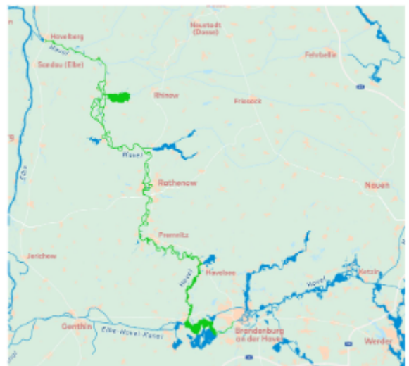
Kaart 1: Vaarbewijsvrij Brandenburg/Havel (klik op de kaart om te vergroten)

Het praktische en theoretische gedeelte van het Charterschein wordt gegeven bij overdracht van het schip en bestaat uit aanleggen, wegvaren, stoppen, draaien in een smalle ruimte, enzovoort. Voor deze extra briefing, Charterschein, worden kosten berekend volgens de geldende prijslijst.