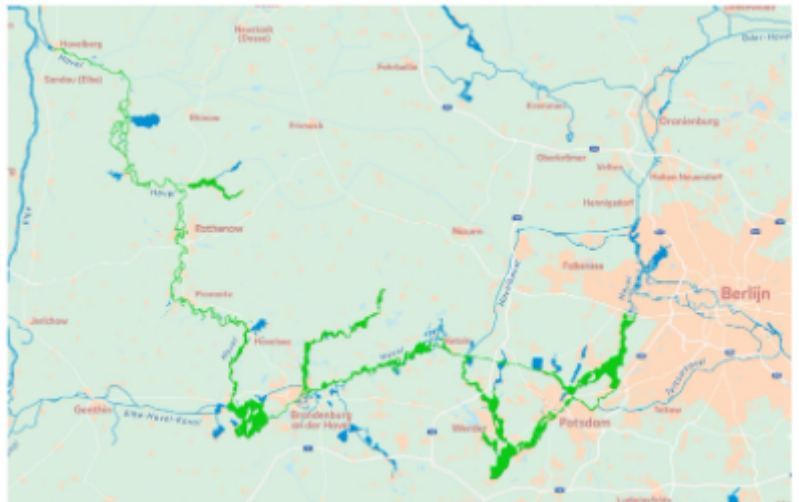
Kaart 2: Vaarbewijsvrij Campi 300 in Brandenburg/Havel (klik op de kaart om te vergroten)

Het Charterschein Campi 300 Houseboat is geldig voor de gehuurde periode, zoals vermeld op het huurcontract. Het varen met het gehuurde jacht in ander gebied, dan aangegeven, is verboden.